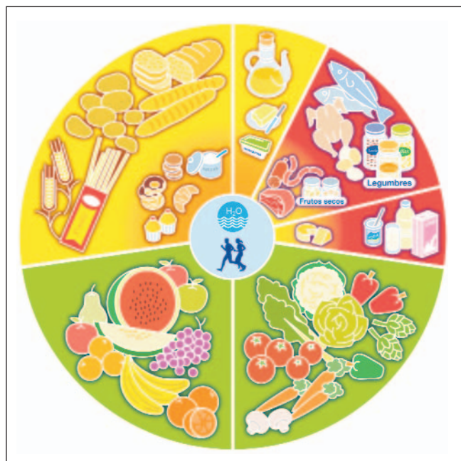
Figura 2. Rueda de los Alimentos.

AGS deben ser inferiores al 10% de las calorías diarias y el colesterol inferior a 300mg, reduciendo al máximo la presencia de ácidos grasos trans .